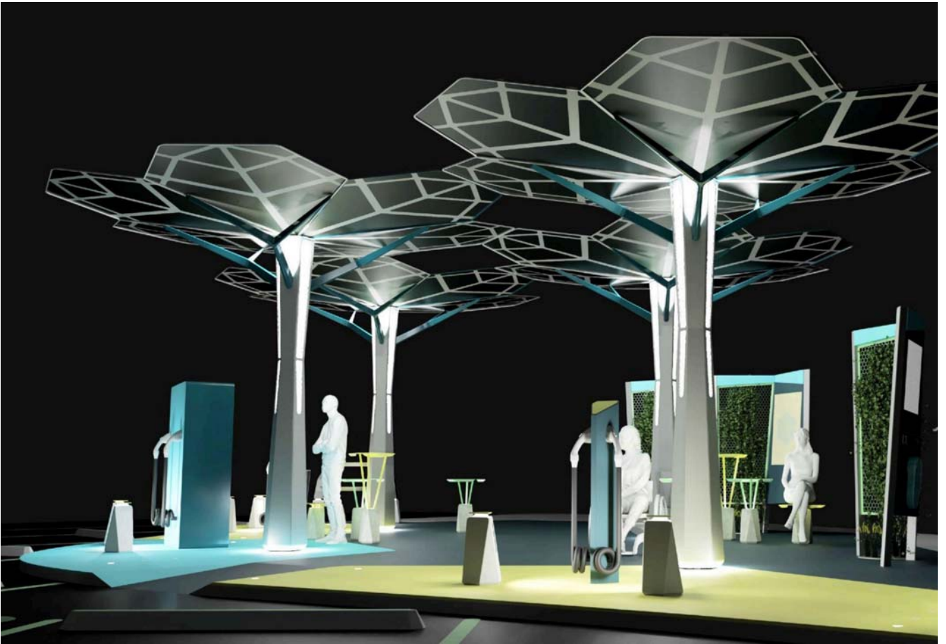
Imagen del resultado del Proceso de Diseño de Estaciones de Carga para Vehículos Eléctricos

2018 , Sistema de Transporte Metropolitano: Consecuencias urbanas de la Implementación en áreas centrales y sus alternativas . Responsable del proyecto. Duración 10 meses. Finalizado y Entregado en Julio 2018. Iniciación a la Investigación. Financiado por FADU/UDELAR