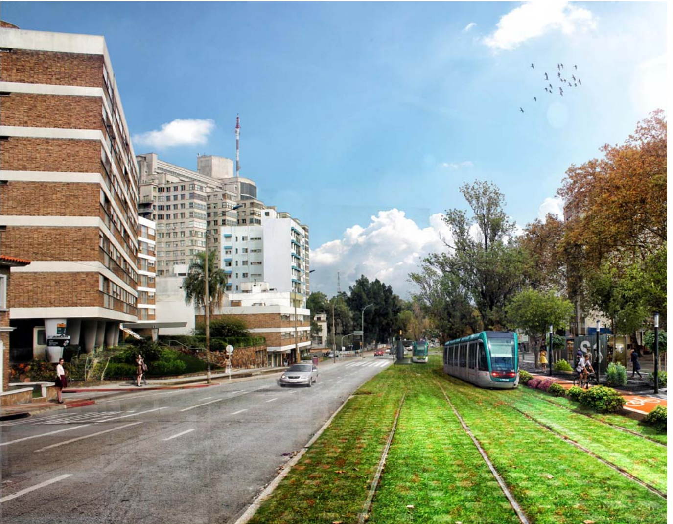
Imagen de propuesta para el Proyecto de Investigación Sistema de Transporte Metropolitano: Consecuencias urbanas de la Implementación en áreas centrales y sus alternativas.