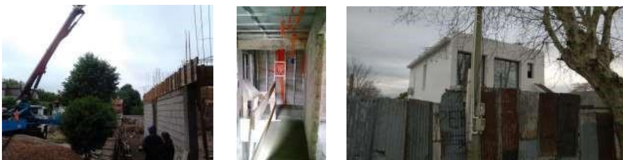
h) Asesoramiento técnico para rehabilitación depósito y talleres de compañía de ómnibus del este (empresa Caraballo) 700m 2 12/12 - 12/13